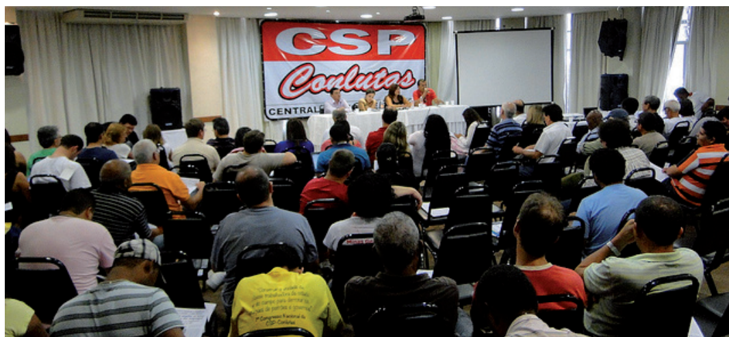
A reunião acontece na sala de eventos do Hotel San Raphael

rodoviários também paralisaram em protesto contra a morte de um trabalhador da categoria, vítima de latrocínio. Em unidade com os trabalhadores da construção civil, cerca de 15 mil se manifestaram pelas ruas da capital cearense.